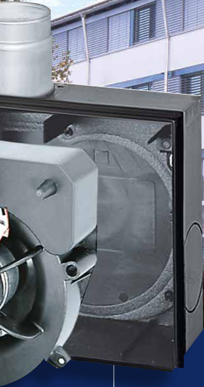
Flaches Gehäuse mit wartungsfreier Absper- vorrichtung