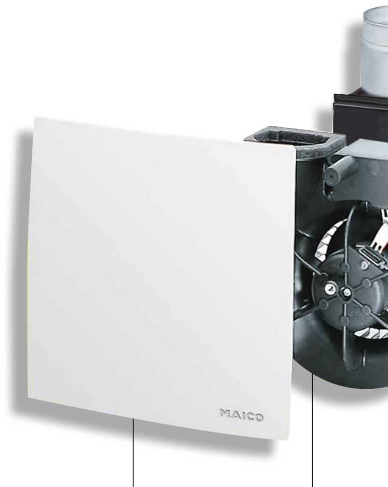
Abdeckung aus hochfestem Kunststoff sphärisch geformt