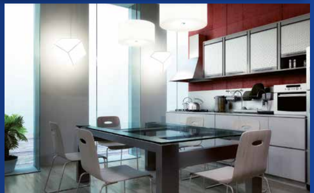
ER-Design passend zu jedem Ambiente